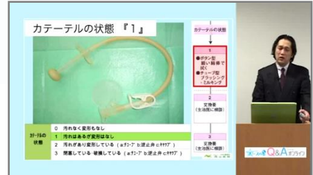
講師:滋賀PEGケアネットワーク世話人 西山医院院長 西山順博先生