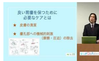
※講義動画イメージ

ナースの星では登録している専門家による看護ケアの講義動画を配信しています。研修会になかなかいけない方も同等の学びを得られます。