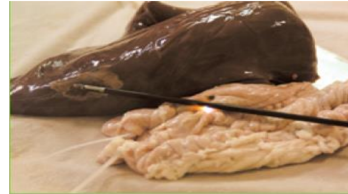
絶縁不良個所からの放電現象