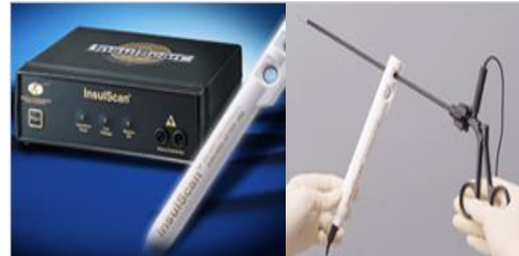
アムコ 鉗子絶縁不良検知器

他にも様々な手術器具テスターがございます。ご要望があれば弊社までご連絡お待ちしております。