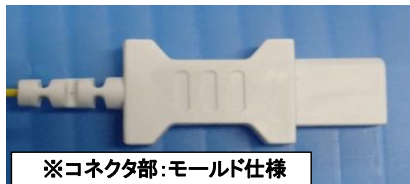
※コネクタ部:モールド仕様