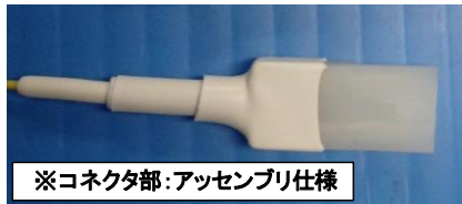
※コネクタ部:アッセンブリ仕様