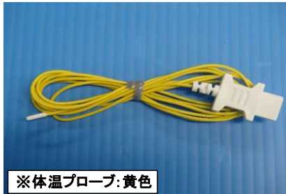
※体温プローブ:黄色