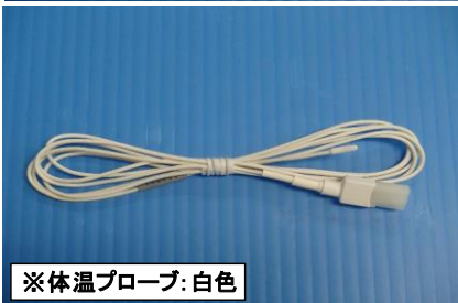
※体温プローブ:白色