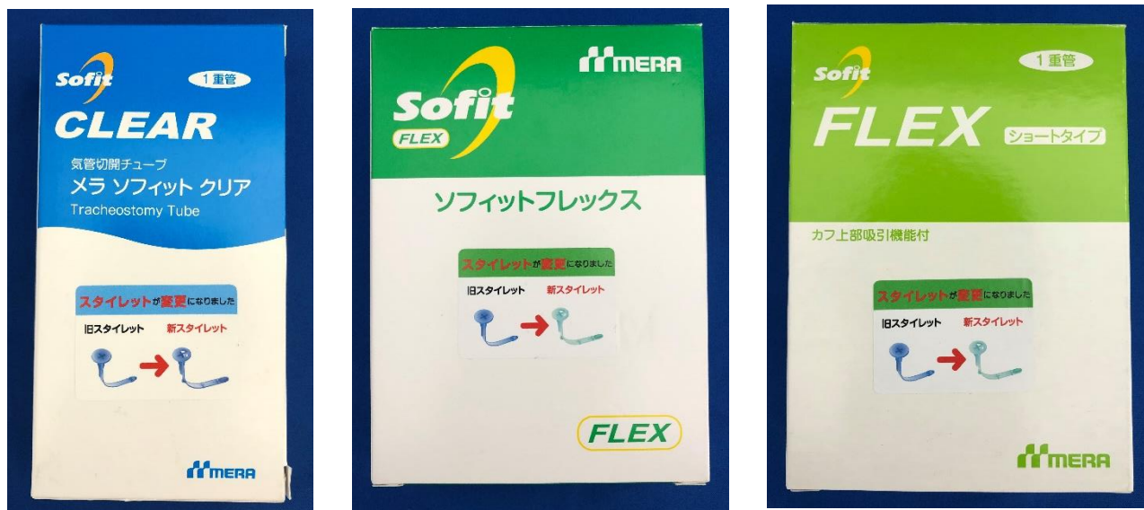
メラ ソフィット クリア ソフィットフレックス ソフィットフレックス ショートタイプ 図3.シール貼付されたメラ ソフィット クリア及びフレックスフレックスの外箱