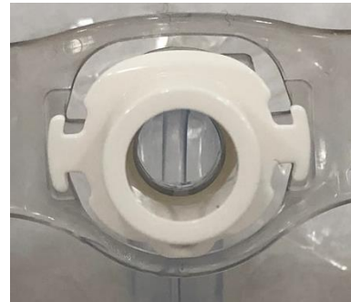
変更品の 15mm コネクタ