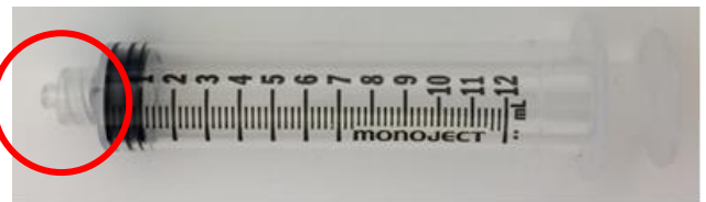
変更後（ルアーロックタイプ）

変更理由：シリンジ供給元のルアースリップタイプが品薄のため、一時的にシリンジの形状を変更します。